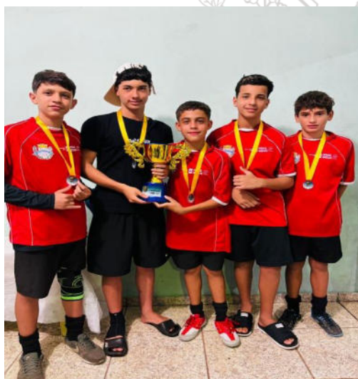
Sub 13 - Equipe Campeã