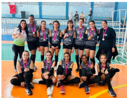
Vôlei módulo I – Vice Campeã