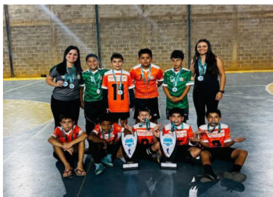
2º lugar - Série Prata