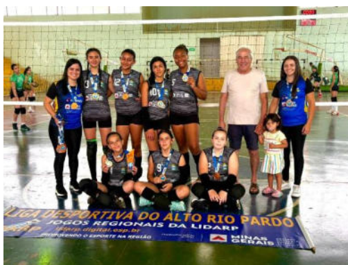
Vôlei sub 13 – 3º lugar