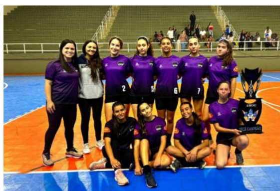
Handebol sub 16 – Vice Campeã