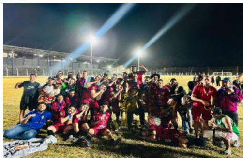
Equipe Campeã – Cruz Preta/Rio Verde