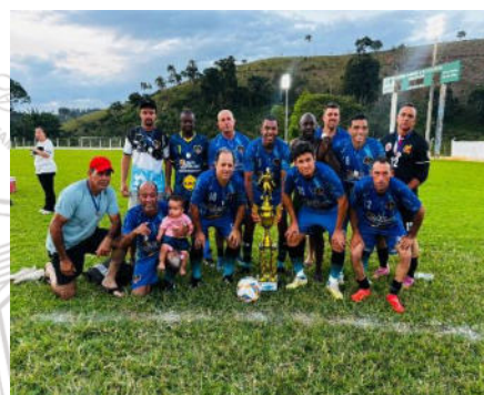
Equipe Vice Campeã – Boa Vista dos Matos