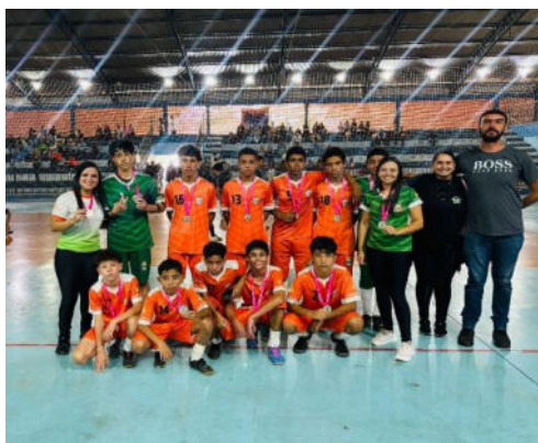
Futsal módulo I – Vice Campeão