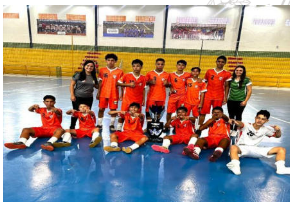
Futsal sub 14 – Vice Campeão