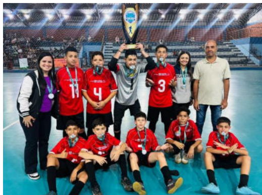
1º lugar – Série Ouro