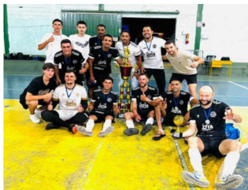
Equipe Vice Campeã – Jardim Eldorado