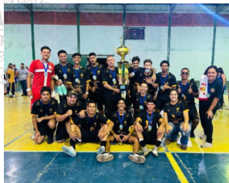
Equipe Vice Campeã – Band Burguer

CAMPEONATO REGIONAL DE FUTEBOL DE CAMPO 2025 “TAÇA PADRE AGOSTINHO”