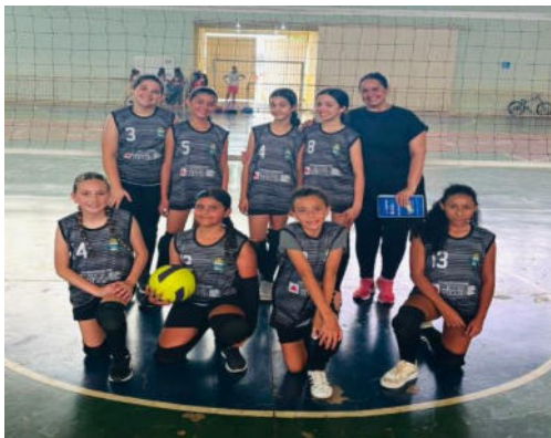
Vôlei sub 11 – 4º lugar