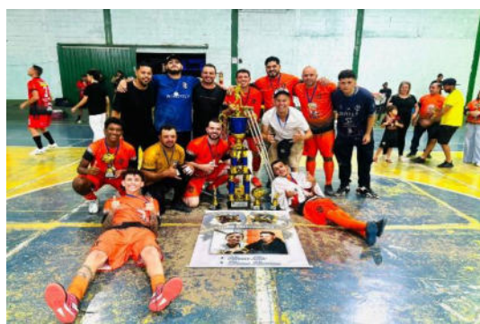
Equipe Campeã – Cruz Preta