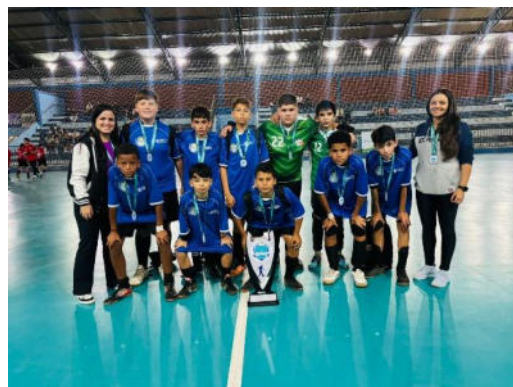
2º lugar – Série Prata