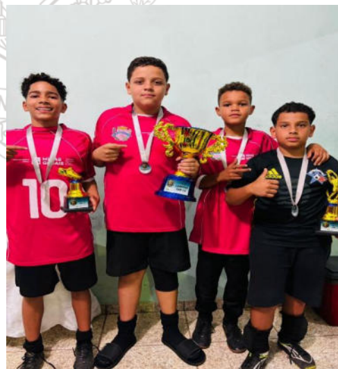
Equipe Vice Campeã