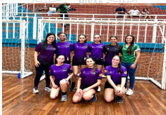
Handebol sub 15 - 5º lugar