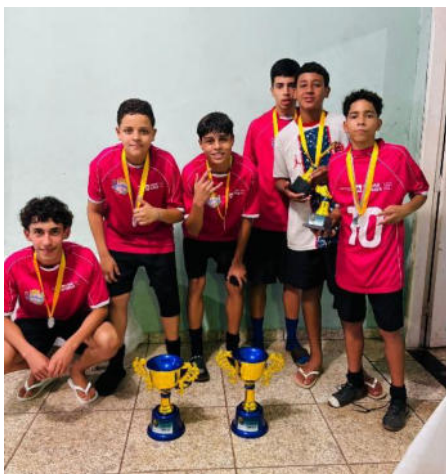
Sub 15 - Equipe Campeã