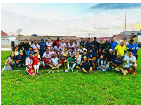
Equipe Campeã – Chiqueirão