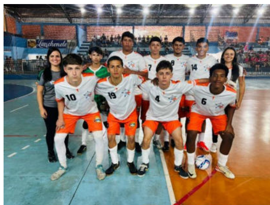
Futsal módulo II