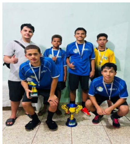
Equipe Vice Campeã