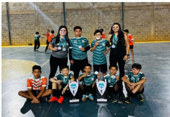
2º lugar – Série Ouro