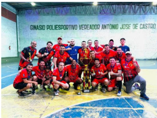
Equipe Campeã – Pé Vermeio/Cruz Preta