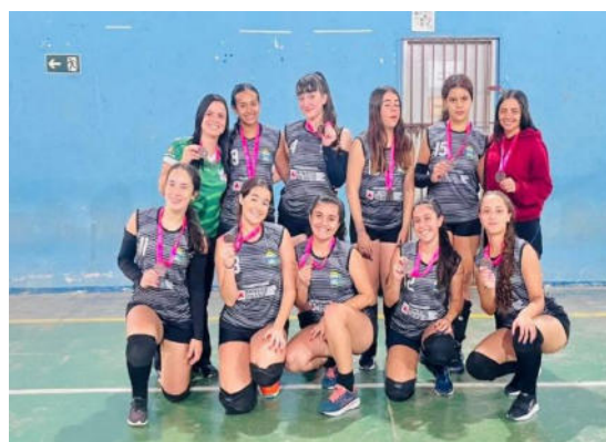
Vôlei módulo II – 3º lugar