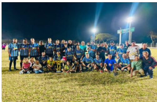
Equipe Vice Campeã – A.A. Santanense