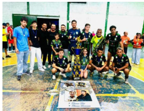
Equipe Vice Campeã - Guarani