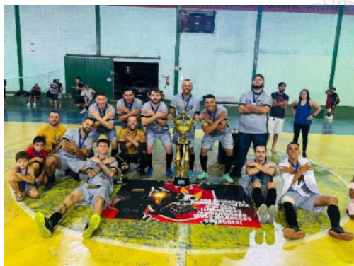
Equipe Campeã – Cruz Preta

Campeonato Municipal de Futsal de Férias 2025 – Taça: João Batista de Paula Filho “Tista do Arthur”