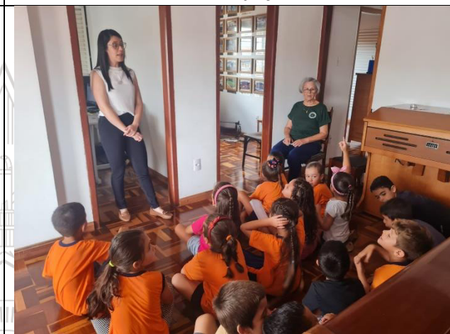
Ações para o Programa ICMS Patrimônio Cultural. Projeto Educação Patrimonial. Ano 2026.