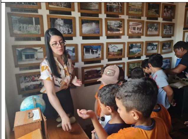
Ações para o Programa ICMS Patrimônio Cultural. Projeto Educação Patrimonial. Ano 2026.