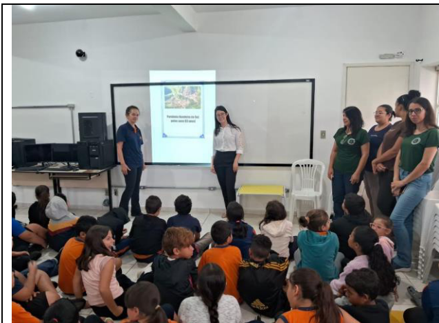
Ações para o Programa ICMS Patrimônio Cultural. Projeto Educação Patrimonial. Ano 2026.