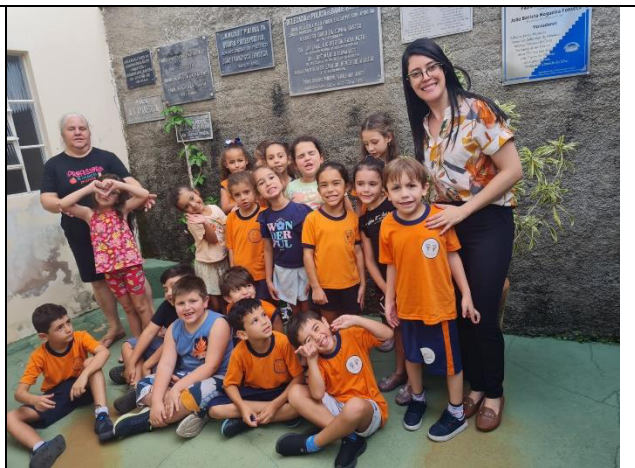
Ações para o Programa ICMS Patrimônio Cultural. Projeto Educação Patrimonial. Ano 2026.