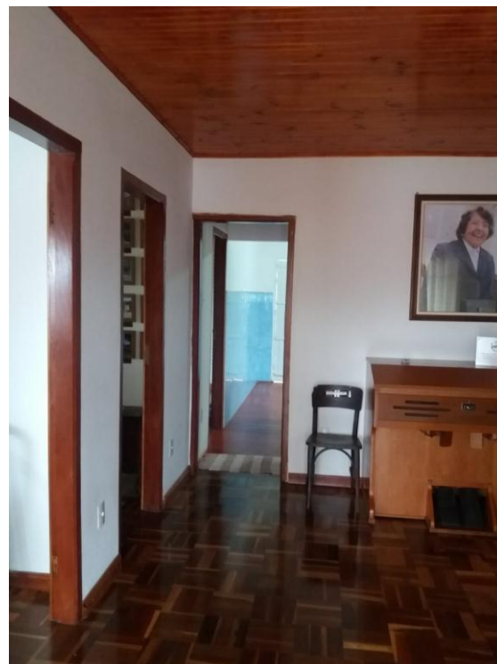
Restauração da Casa das Irmãs