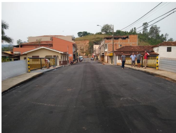
Ponte da Rua Dr. Afonso Dias de Araújo