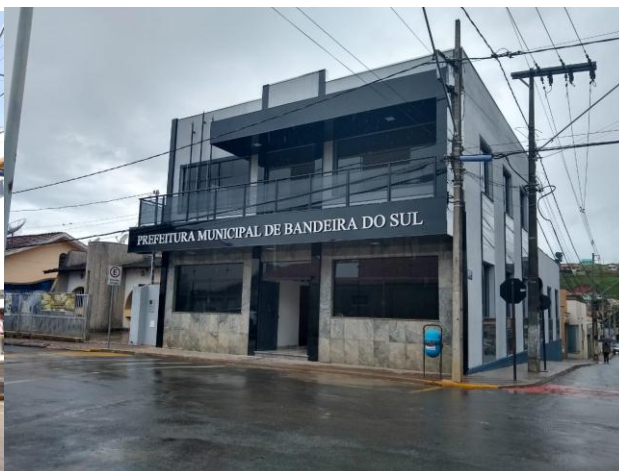
Sede da Prefeitura Municipal