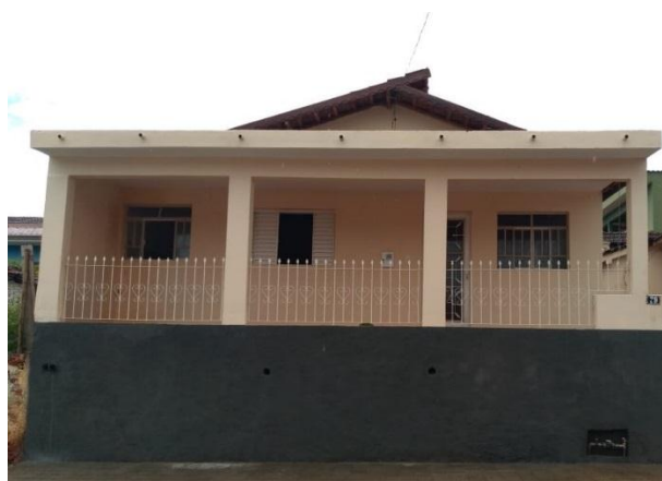
Restauração da Casa das Irmãs