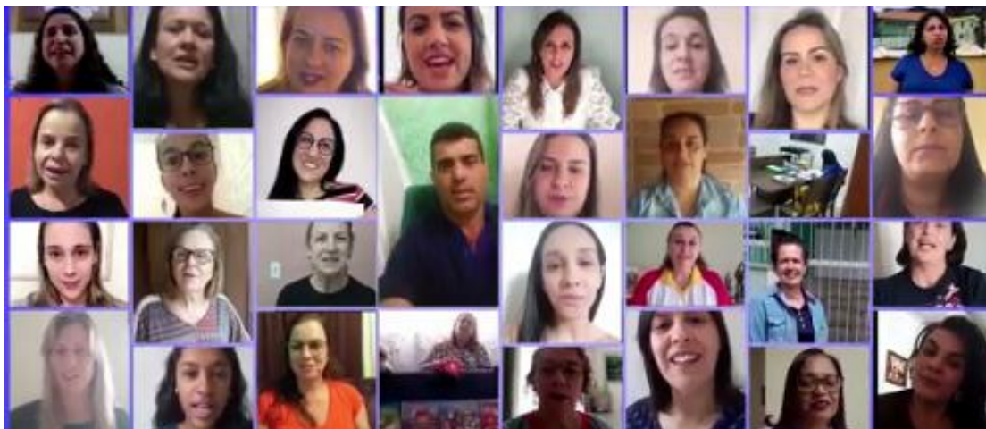
Projeto Atendimento Escolar Remoto