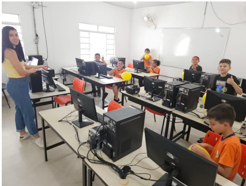
Projeto Teclando Oportunidades