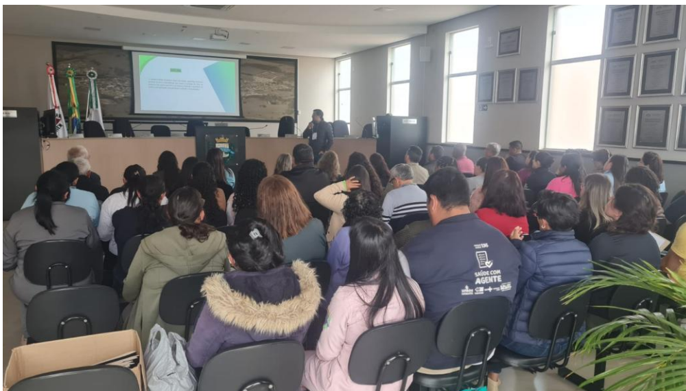
VII Conferência Municipal de Saúde