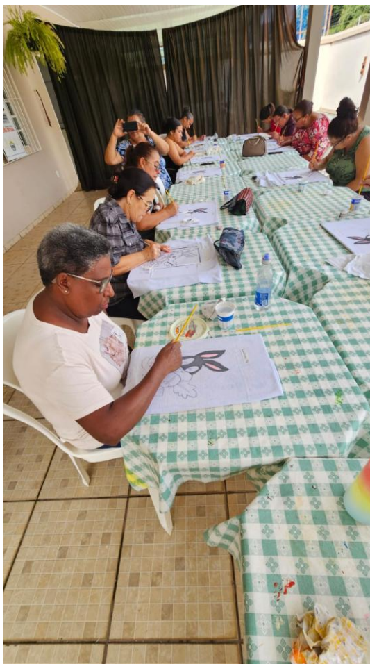
Atividades de Fortalecimento de Vínculos