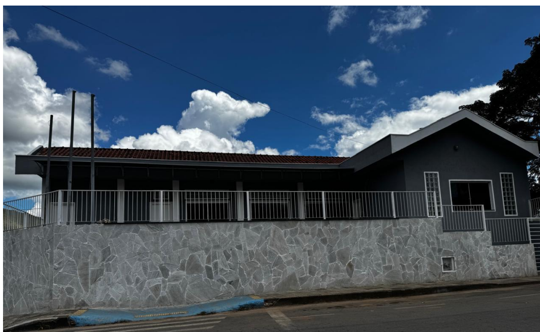
Reforma da Biblioteca Municipal