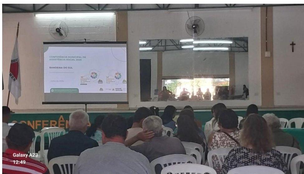
XII Conferência Municipal de Assistência Social