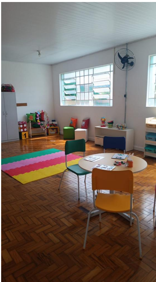
Sala de Recurso Escola Municipal Adelaide Muniz da Silva