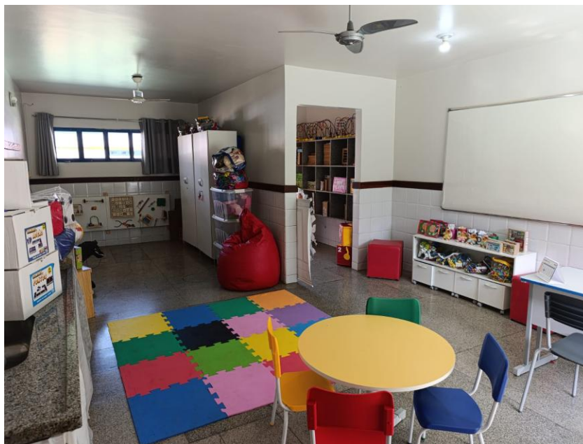
Sala de Recurso do CMEI Luiz Carlos Viana